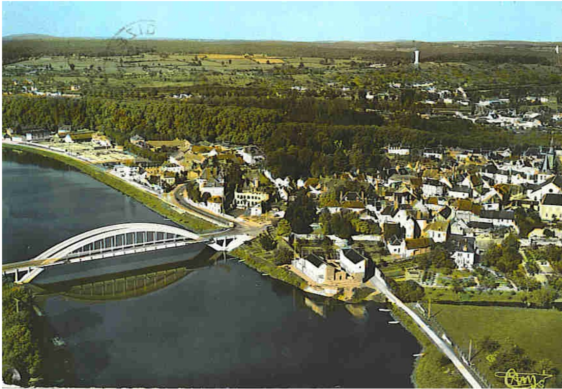
Le nouveau pont du Faubourg d'Allier.