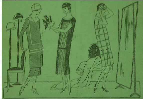
LA MODE FEMININE ( Paris-Centre ).